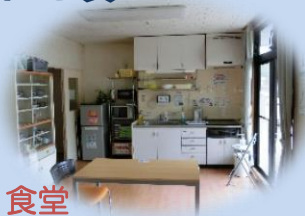
食堂 テレビでBS視聴できます。