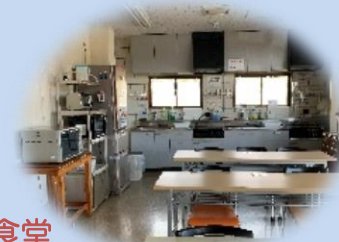
食堂 レンジ・トースターもあります。