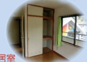
居室 たくさん収納できますよ。