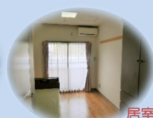
居室 日当たり良好☆