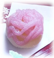
和風モンブラン (いちご風味)